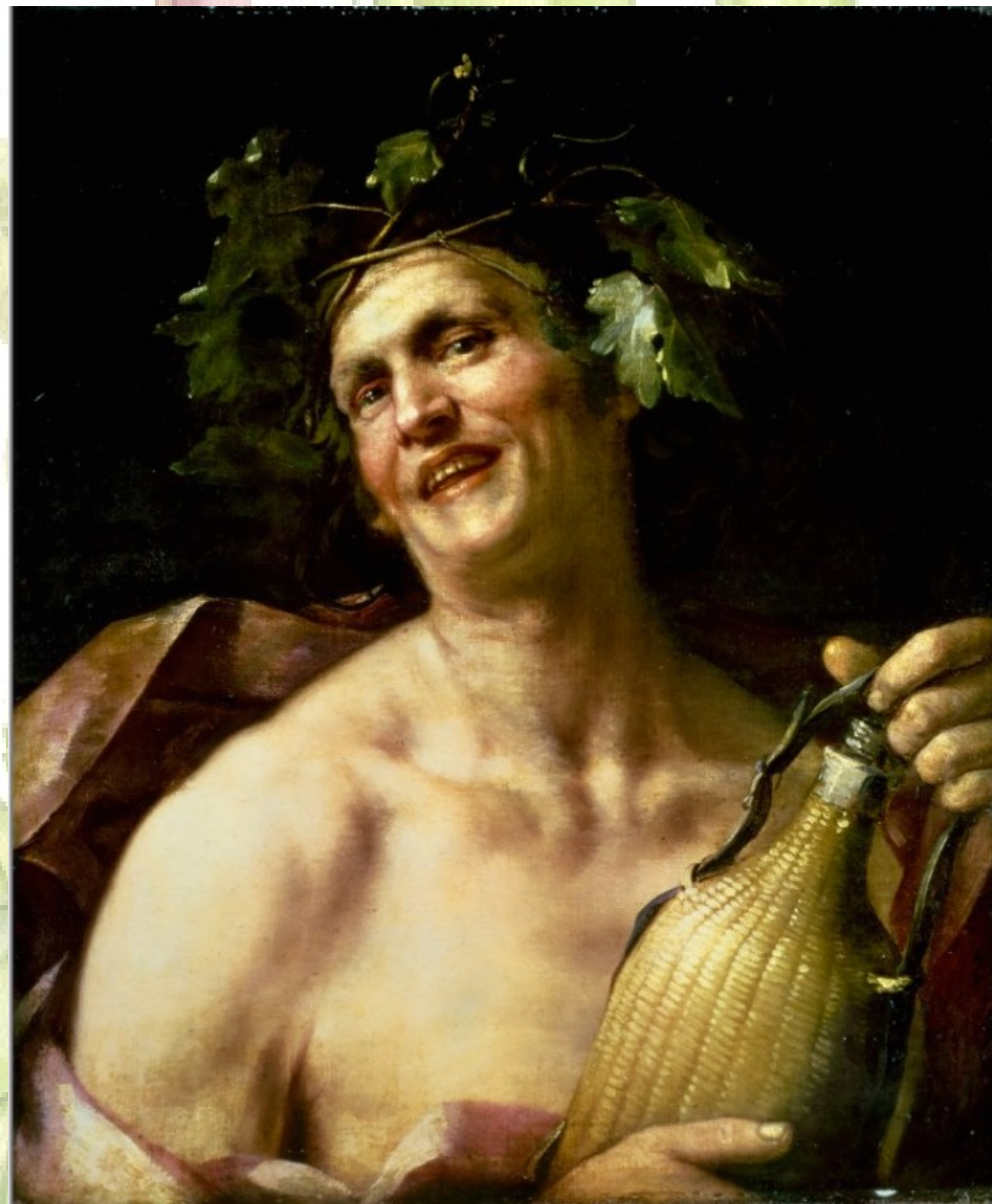
Jan Van Dalen: Nevető Bacchus