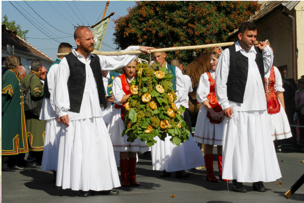
szőlőből készített hatalmas fonat