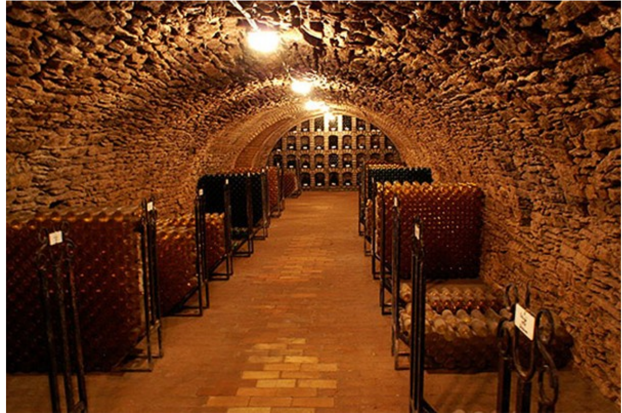
Móri kapucinus pince (Bozóky pince)