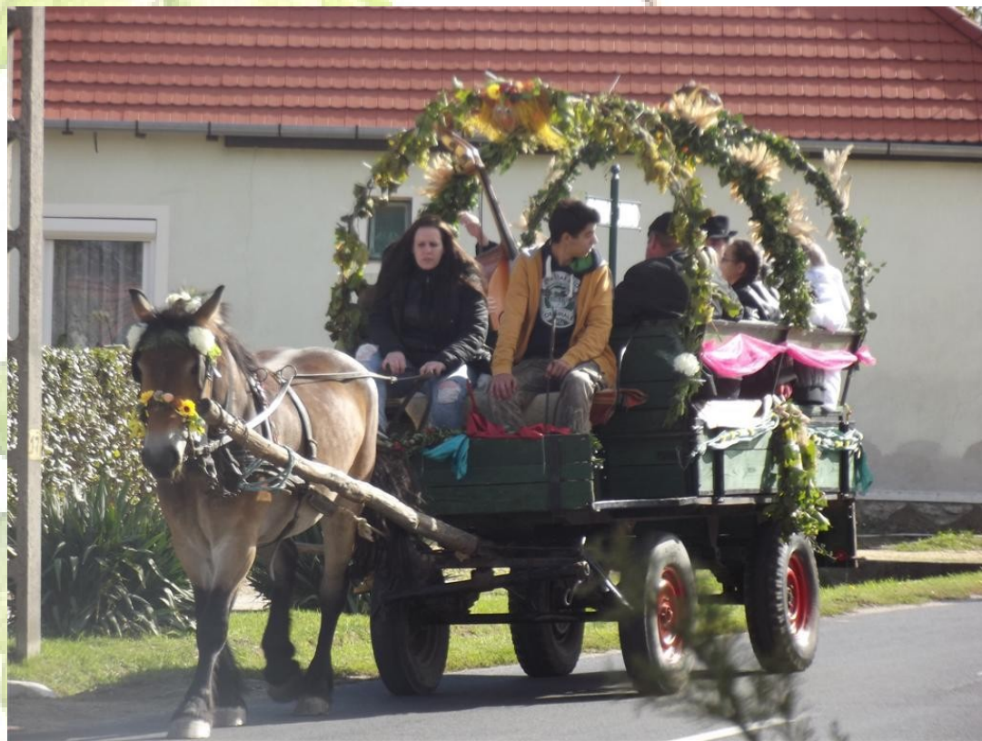
Felcicomázott lovas kocsi