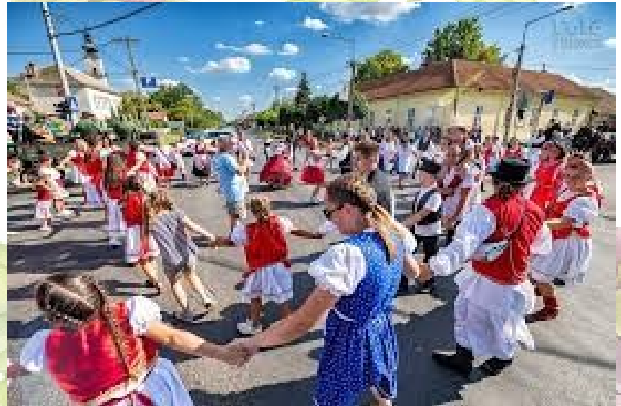
Önfelelt szüreti bál