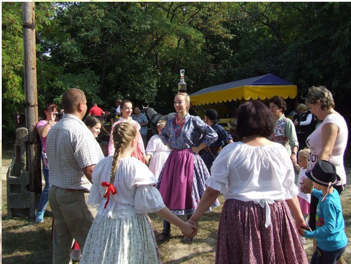
Pillanatkép a győri szüreti bálról