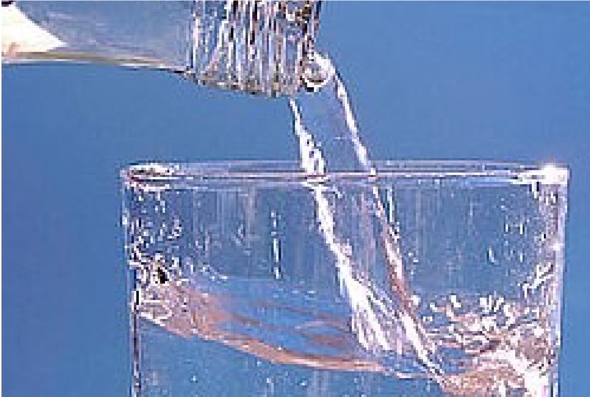
A „trükkös bor”