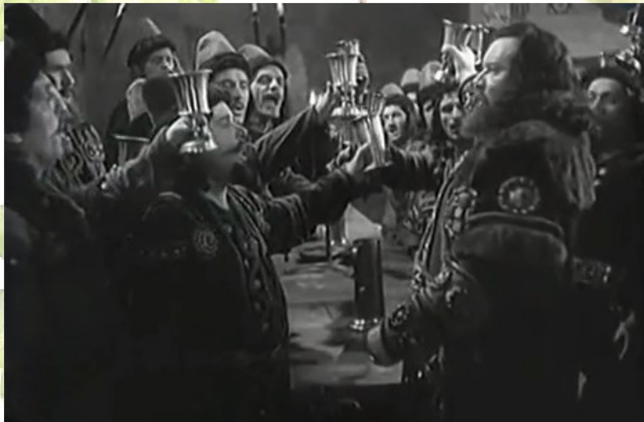
Jókedvű, nótázó férfiak