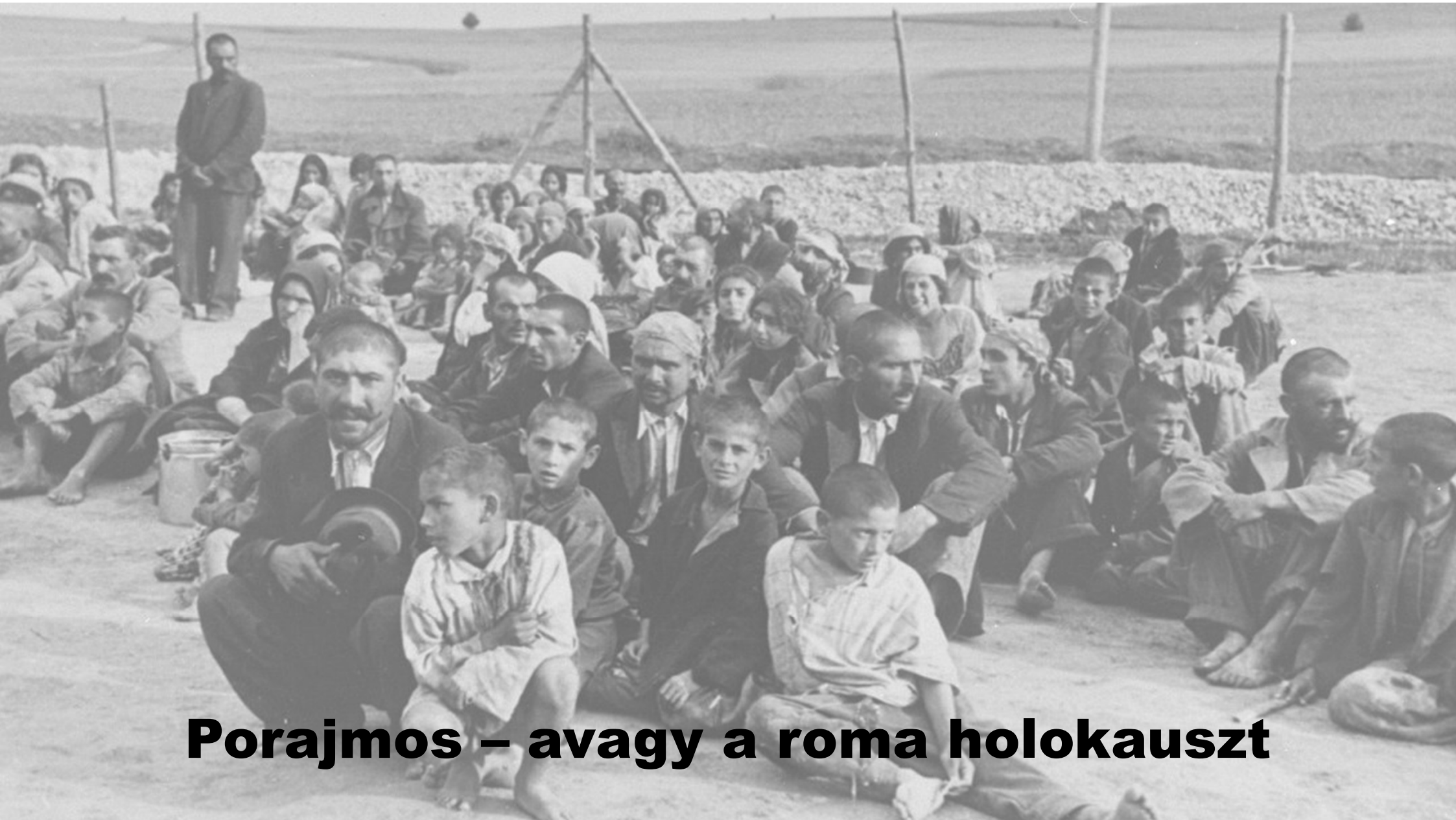
Porajmos – avagy a roma holokauszt